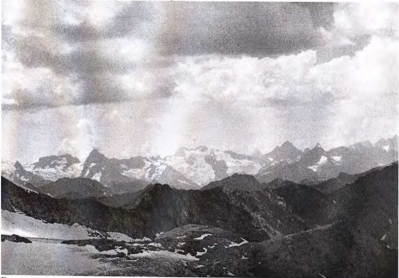
Вид на запад с перевала Джолсузчат.