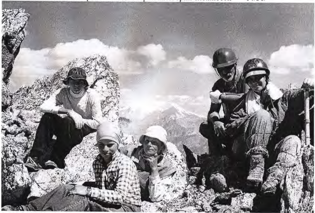
Группа на перевале Искровцев