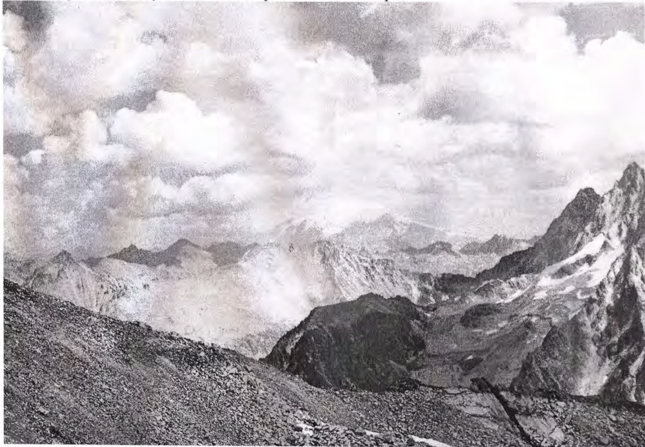
Вид на Эльбрус с перевала Джолсузчат.