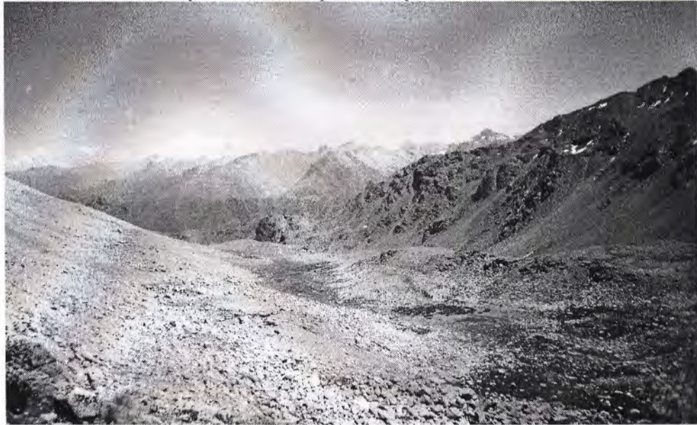
Вид с перевала Кышкаджер на восток.