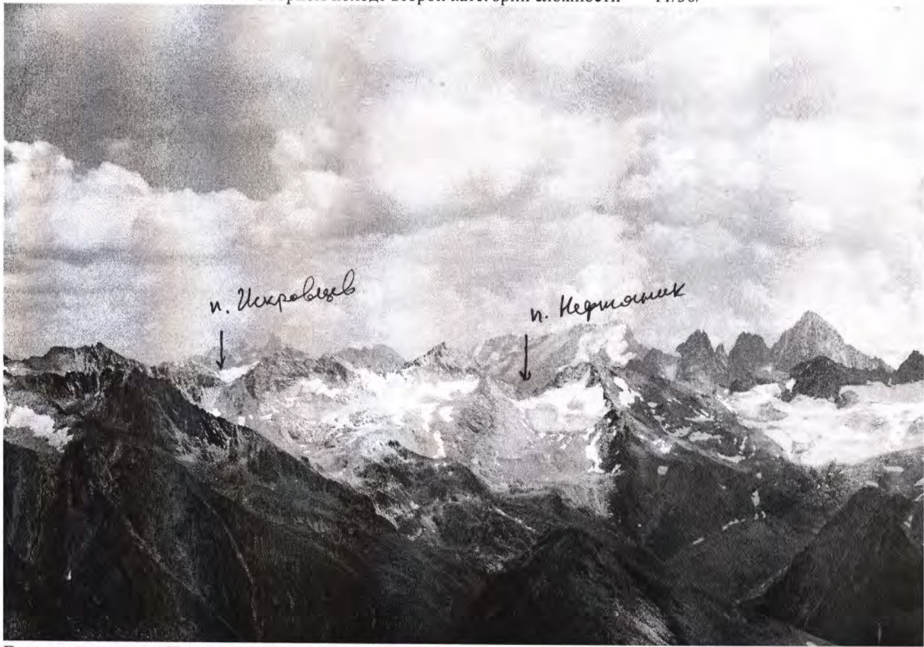
Вид на верховья Даута с перевала Джолсузчат.