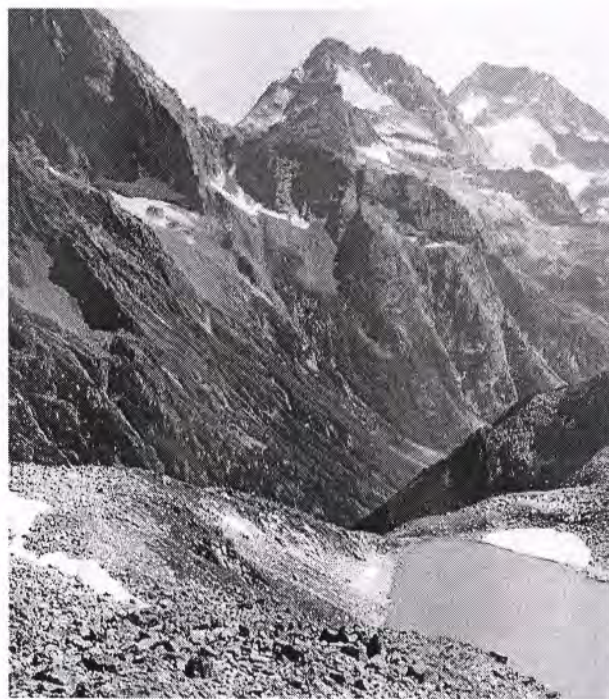
Лагерь у озера Северное Трехозерное

Кирпичу. Кирпич возложен неизвестным туристом на высшей точке уступов, поднимающихся террасами в направлении к северо-западу от озера, недалеко от скалистых стен вершинки, возвышающейся над озером.