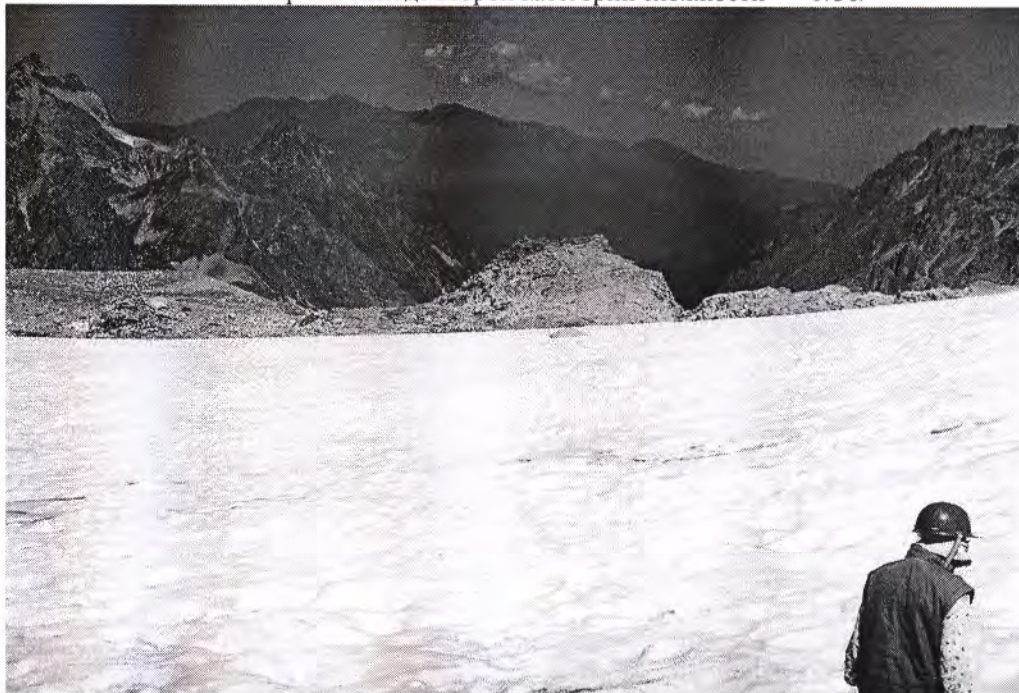
Ледник на западном склоне перевала Назлы-Рынджи

Перевал Джолсузчат (3300 м, 1-Б), радиально, с перевала Назлы-Рынджи.