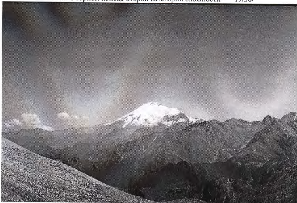
Вид с перевала Кышкаджер на Эльбрус

14 час. 10 мин. – начало спуска в долину реки Кичкинясу. Спускотропа хорошо просматривается; склон осыпной средней крутизны.