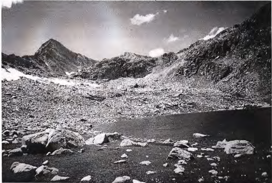
Нижнее Рынджинское озеро