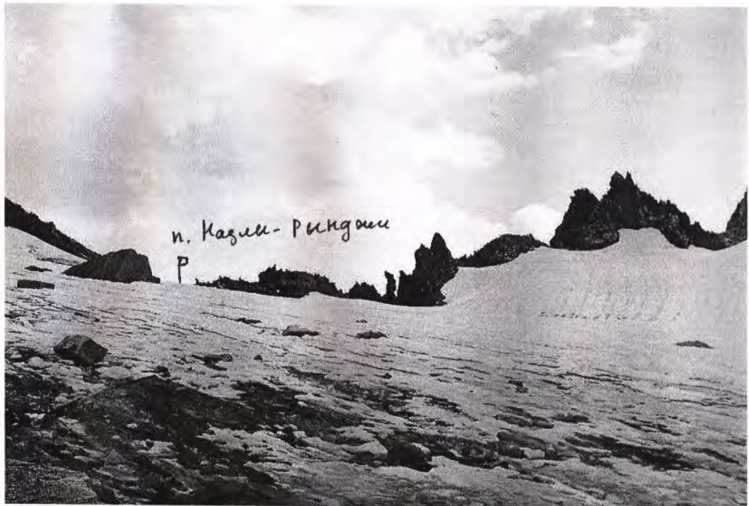
Перевал Назлы-Рынджи с запада