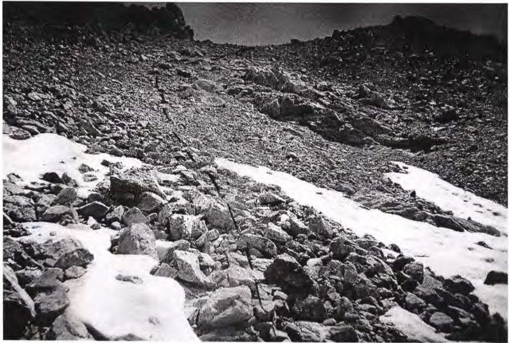
Подъем на перевал Искровцев

Чистое время подъема на перевал от озера Искровцев - 1,5 часа. Чистое время спуска с седловины до дна цирка - 25 мин.