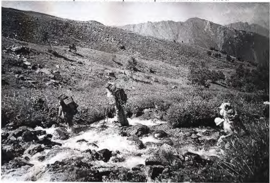
Переправа через реку Кышкаджер

11 час. 40 мин. - окончание переправы и остановка на обед.