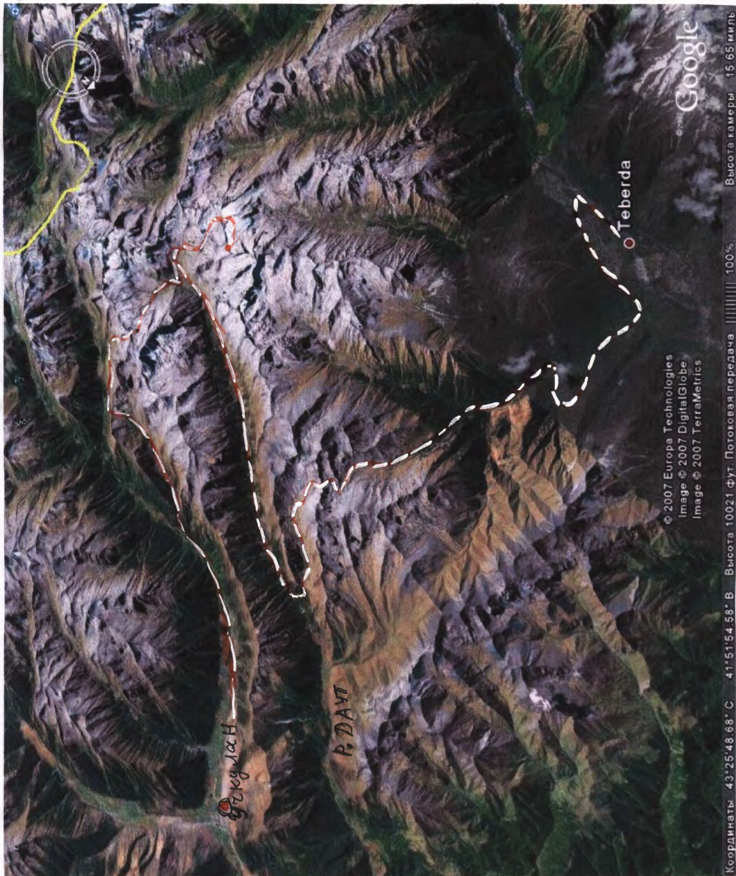
Западный Кавказ, Карачаево-Черкессия.