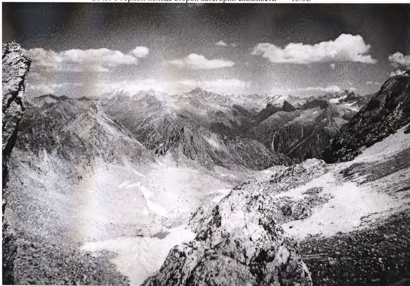
Вид с перевала Искровцев на восток.