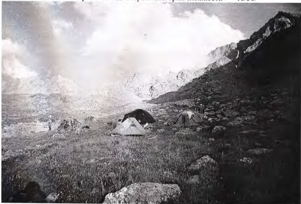
Лагерь в долине реки Кышкаджер