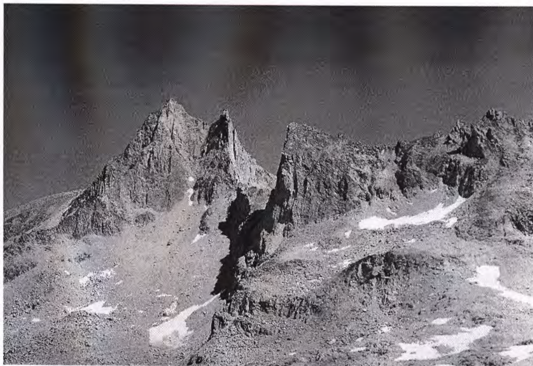
Щель перевала Горалыкол

Двигаясь вниз по гребешку, прошли метров 150, и нашли пологий снежный спуск на ледник в цирке пер. Джолсузчат. С ледника хорошо виден пер. Джолсузчат, а севернее него характерная щель пер. Горалыкол.