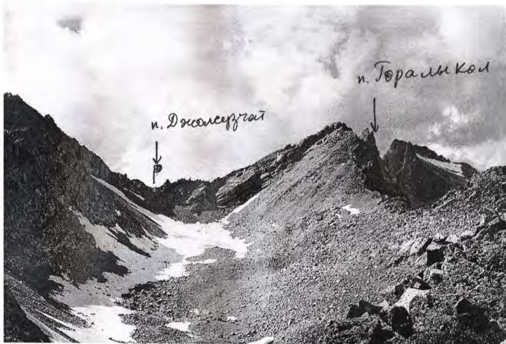
Перевал Джолсузчат с востока