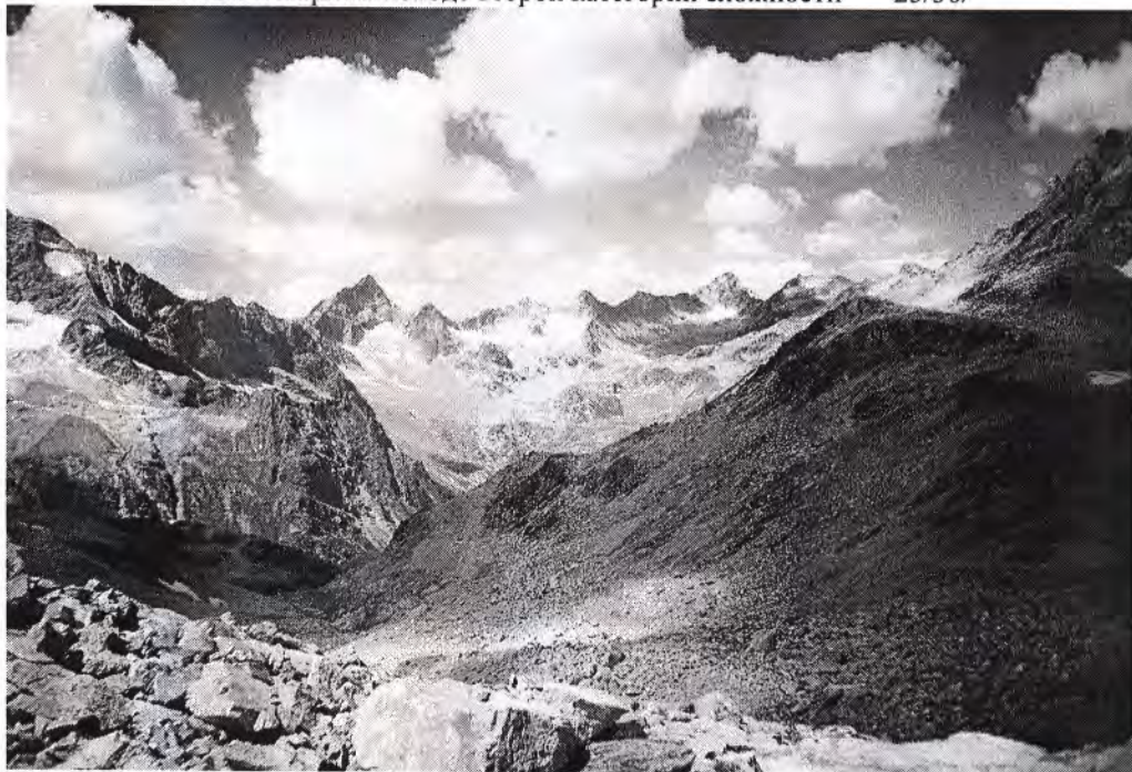
Вид от озера Искровцев на Кышкаджерский хребет