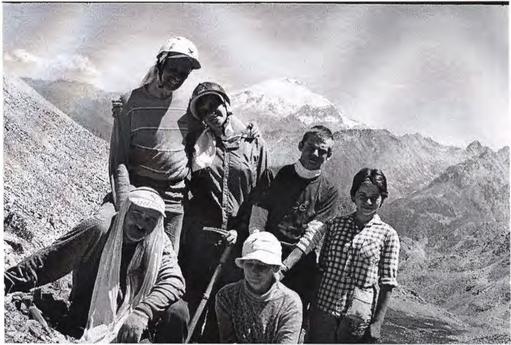
Группа на перевале Кышкаджер