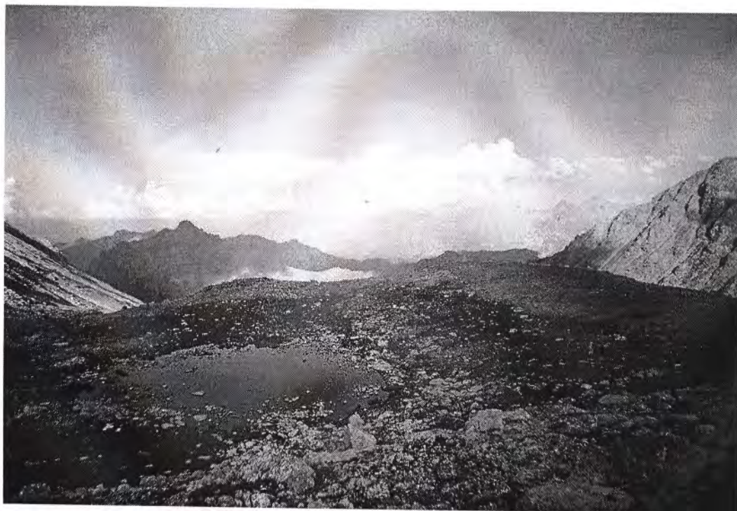
Место ночлега у озерца