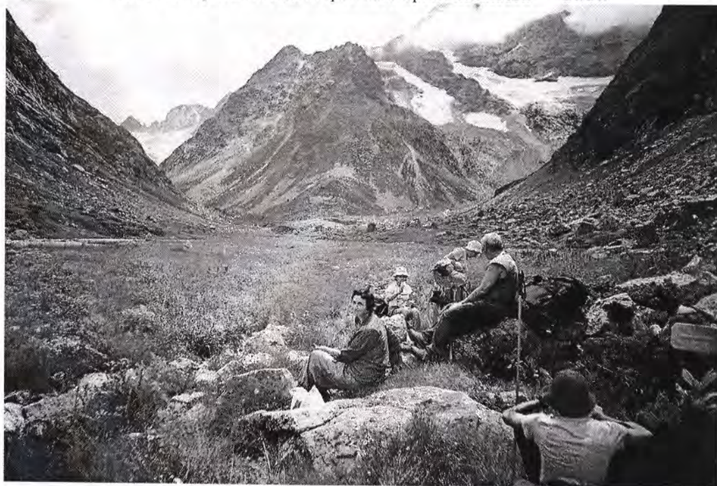
Слияние рек Даута и Рынджи