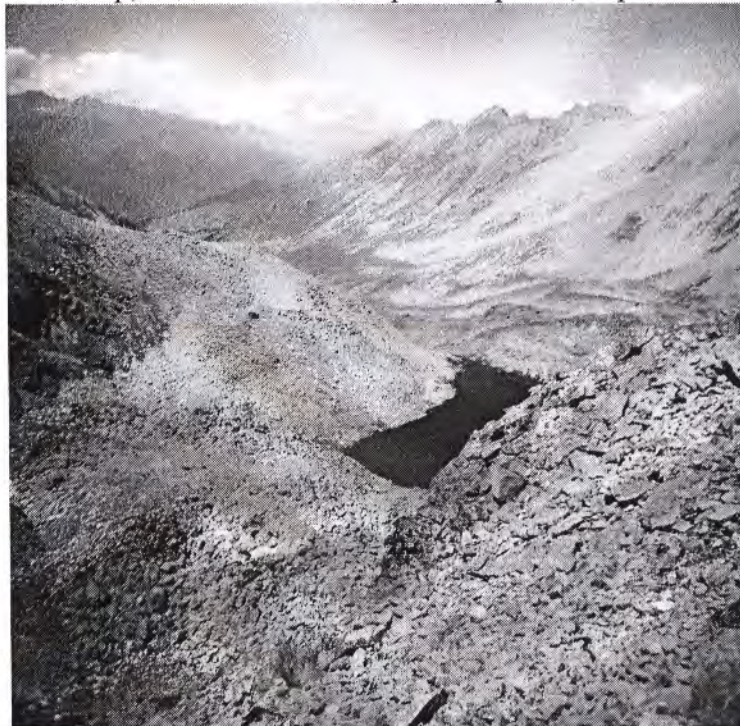
Вид с перевала Кышкаджер в долину реки Кышкаджер.