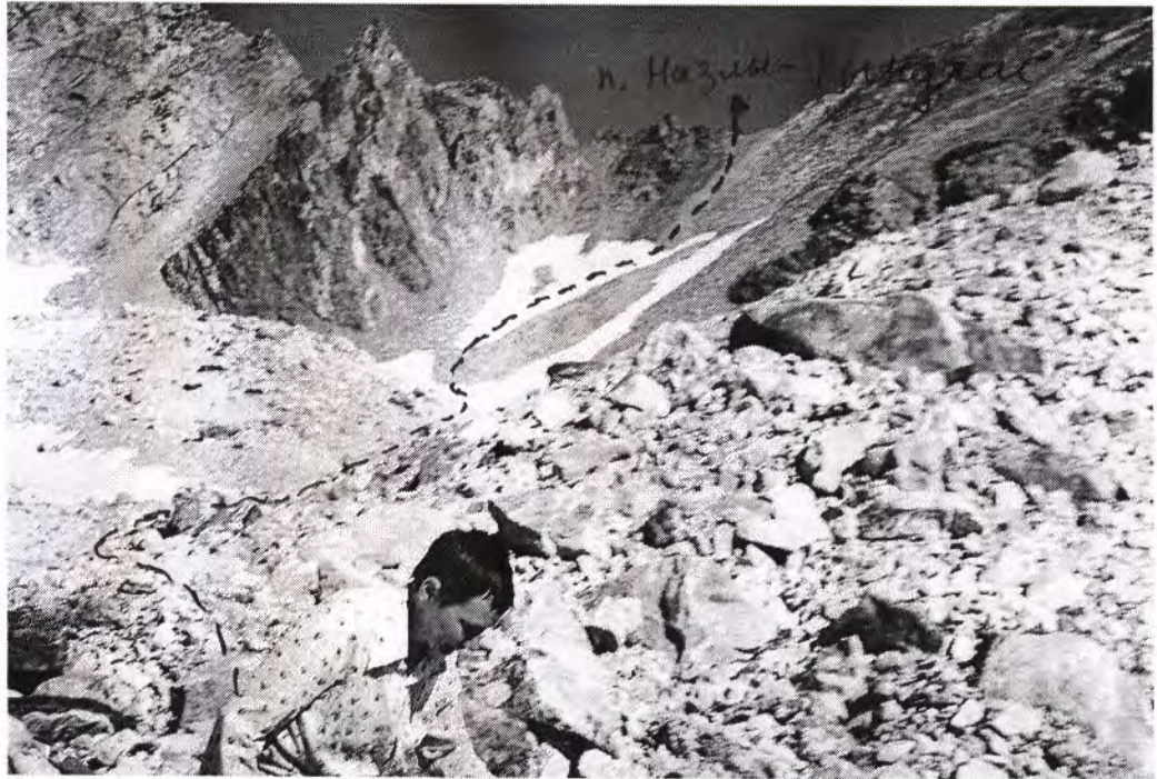
Перевал Назлы-Рынджи с востока

Западный склон перевала - пологий закрытый ледник, спускающийся в долину р. Назлы.