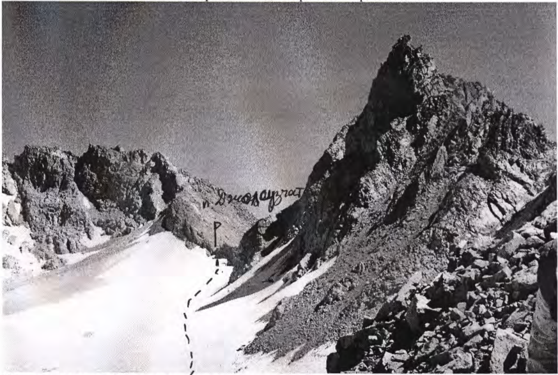
Вид на перевал Джолсузчат с запада, с разделительного гребня.