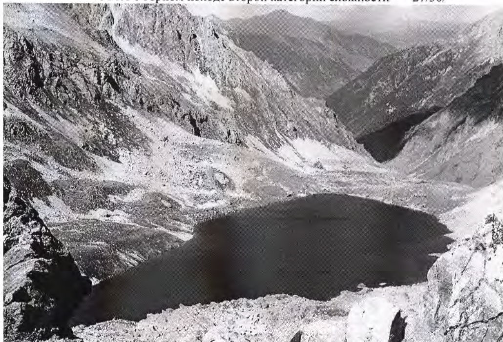
Вид с перевала Уллу-Кель Западный на озеро Большой Уллу-Кель