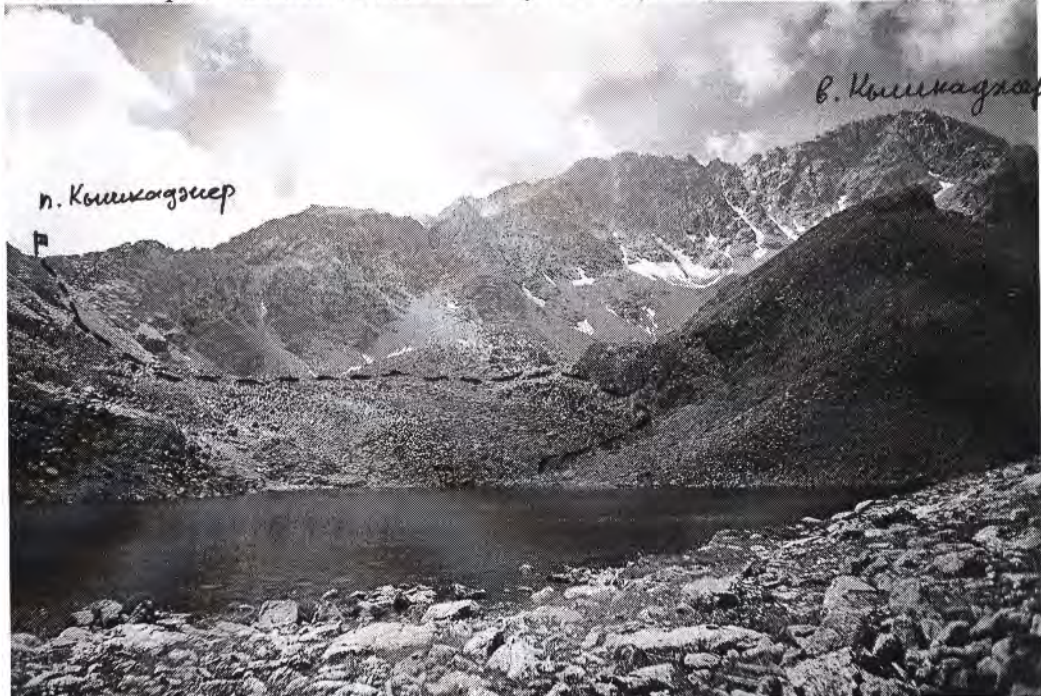
Озеро Кышкаджер, вид на Кышкаджерский хребет, перевал Кышкаджер.

Подъем на перевал начинается за моренными увалами, окаймляющими Кышкаджерское озеро с востока. Перевальный взлет представляет собой осыпной склон крутизной до 35 градусов; осыпь среднего размера. Склон разделен на две части скальным гребешком. Традиционно путь подъема проходит с правой (по ходу) стороны гребешка. Левая сторона короче, но круче и выводит в седловину, метров на 10 выше основной перевальной седловины; группа прошла этим путем. Спуск с перевала простой, по некрутой осыпи, поросшей мхом и травой. Чистое время подъема на перевал – 45 мин.; спуск с седловины на дно цирка – 20 мин. Подъём и спуск следует производить плотной группой.