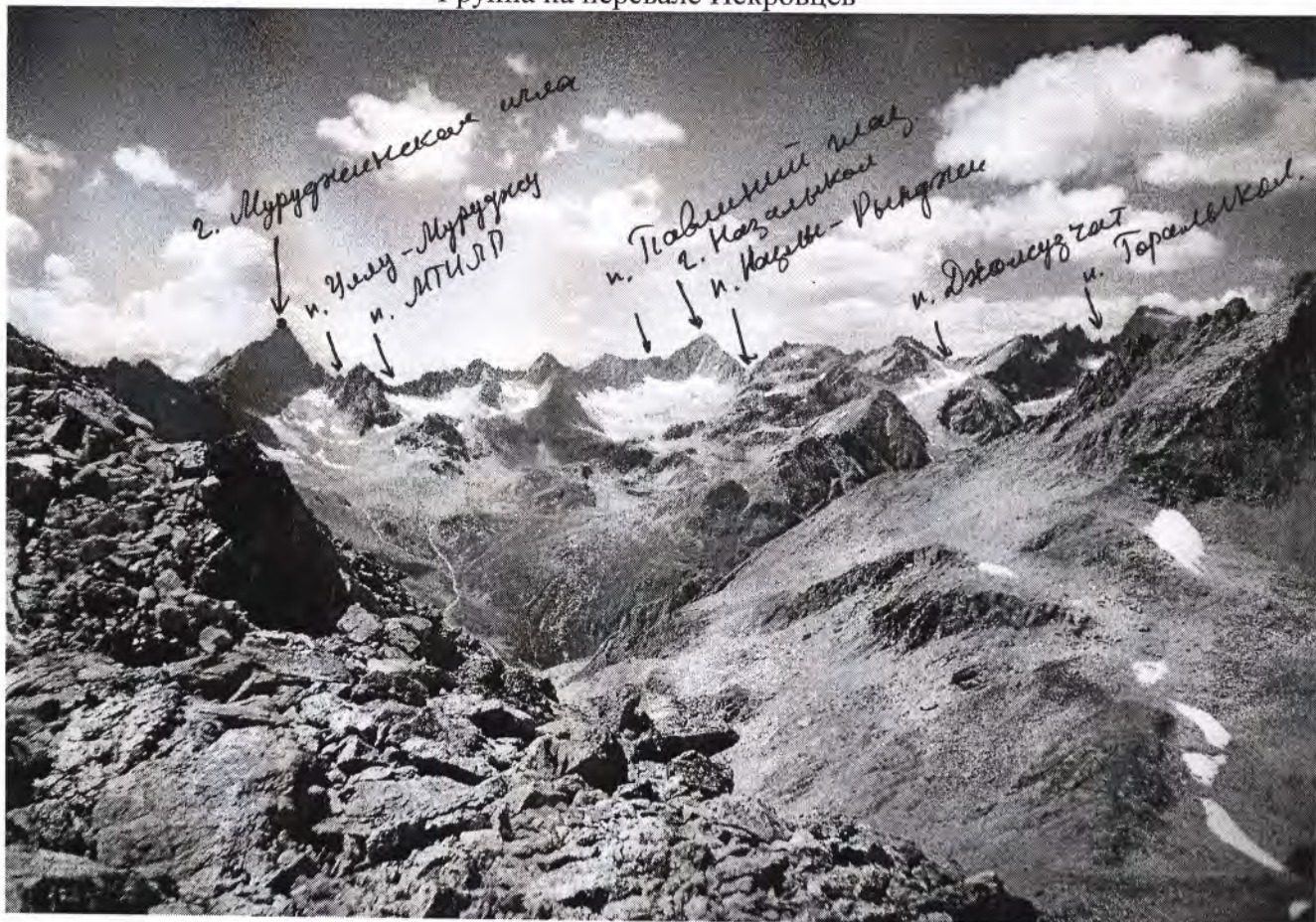
Вид с перевала Искровцев на Кышкаджерский хребет.