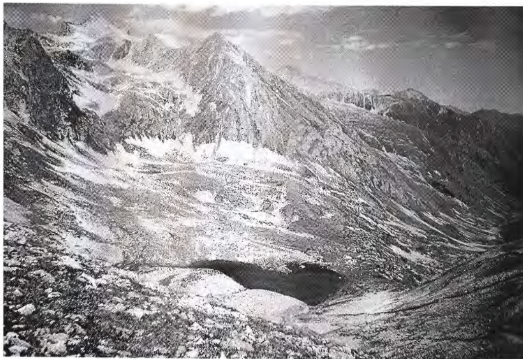
Вид с хребта на озеро Уллу-Кель Нижнее

14 час. 07 мин. - обед на берегу озера Уллу-Кель Нижнее.